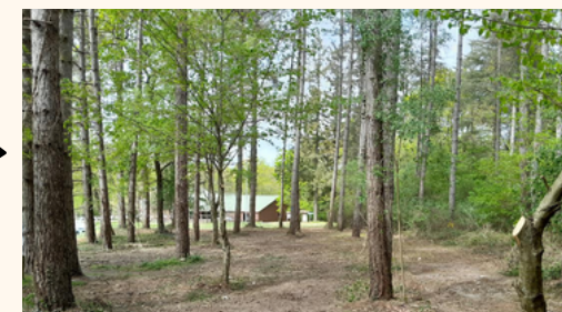
4. Elagage des arbres maintenus (2m)