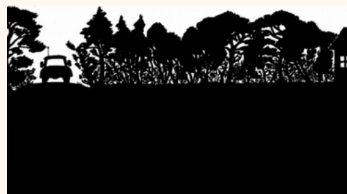
1. Coupe et élimination de la végétation basse

LE DÉBROUSSAILLEMENT N'EST PAS DU DÉFRICHEMENT