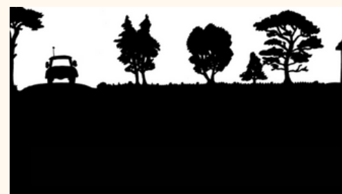
Le cas échéant (choix préfectoral), coupe et élimination des végétaux dans le périmètre des constructions et à l'aplomb des voiries