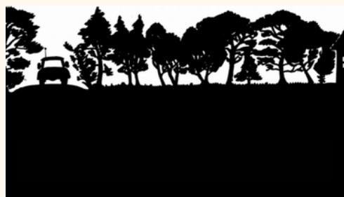
2. Coupe et élimination des arbres et arbustes en densité excessive, des arbres morts