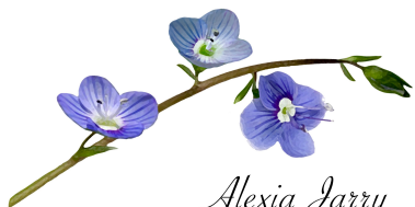
Alexia Jarry Photographe

Je suis à l'écoute de vos histoires, et je vois en vous ce que vous ne voyez peut-être pas. VOTRE BEAUTÉ.